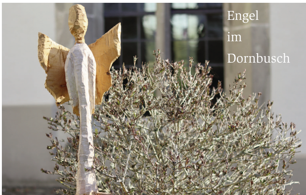
Engel im Dornbusch