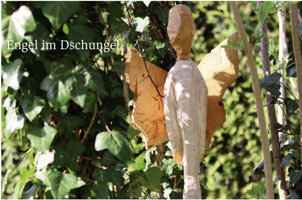
Engel im Dschungel